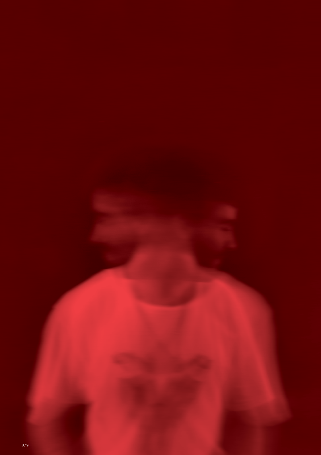
IMAGEN EN MOVIMIENTO

TRABAJOS EN TORNO A LA ALFABETIZACIÓN AUDIOVISUAL